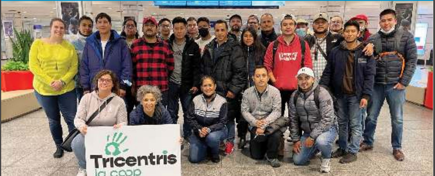
Nos nouveaux Tricentrisiens à leur arrivée à l'aéroport de Montréal.