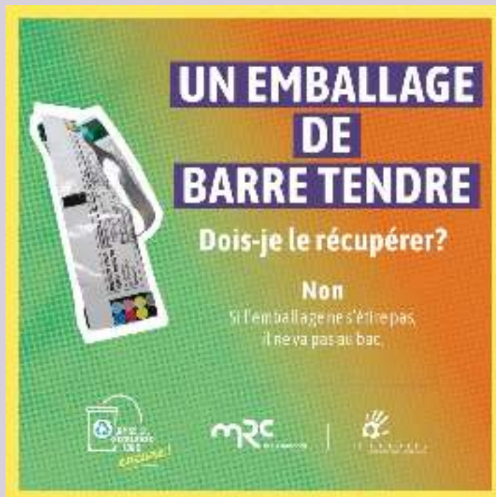
Des conseils ont été diffusés sur les médias sociaux grâce à la campagne de sensibilisation de la MRC de L'Assomption.

Pour plus d'informations ou pour inscrire votre projet au programme, rendez-vous sur notre site au www.tricentris.com . La date limite pour présenter une demande est le 1 er octobre 2022.